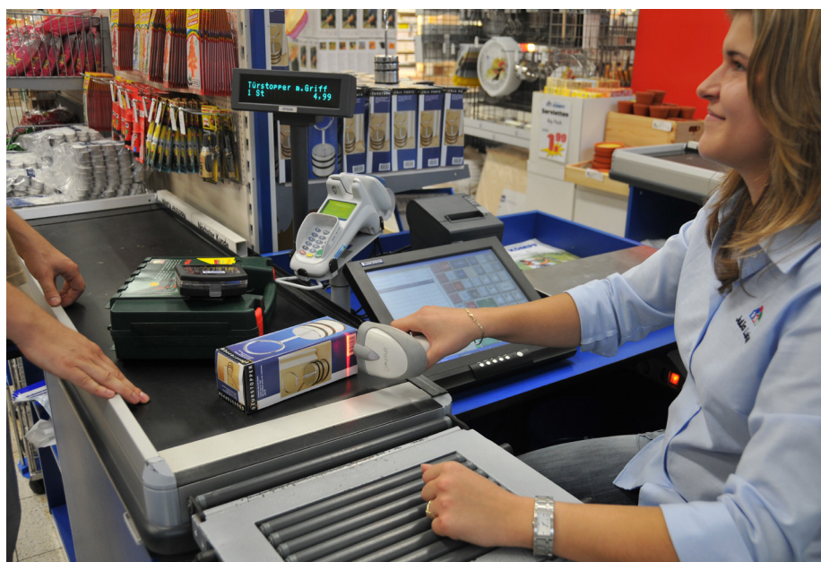
InfoCash in Aktion im Bauzentrum Kömpf, Calw

Die Kassenlösung InfoCash bildet für die Infokom einen bedeutenden Meilenstein im Zuge der Umsetzung ihrer Softwareentwicklungsstrategie der sanften Migration. Im harten Praxiseinsatz beweist InfoCash seine Vorzüge Tag für Tag eindrucksvoll.