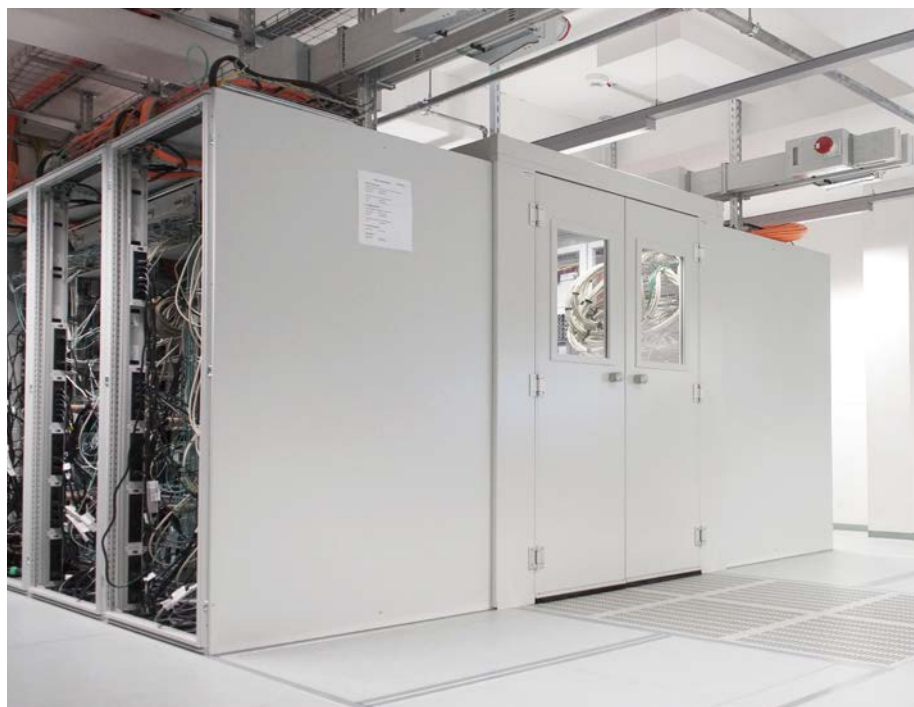
Hochleistungsrechenzentrum Infokom GmbH, Karlsruhe

Und genau hier kommen wir ins Spiel. Mit unserem modernen Rechenzentrum in Karlsruhe und unserer langjährigen Erfahrung im Management und in der Administration verschiedenster